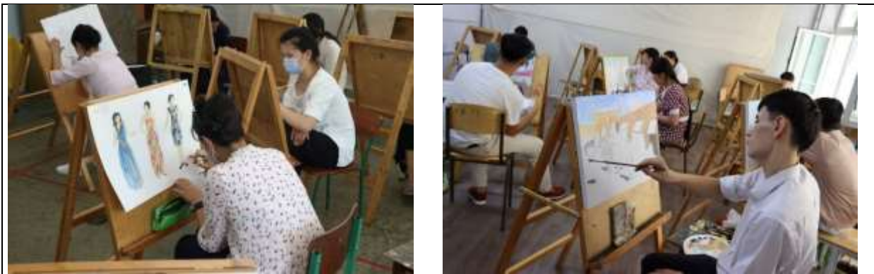
Рисунок 1. Занятия в художественном училище

академических принципах. Существенное влияние на этот процесс оказало прибытие в Среднюю Азию русских художников и педагогов.