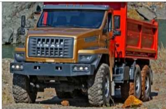
1-расм. УРАЛ “евро-1”.

мажмуи амалга оширилади, (жанговар машиналарнинг ўт очиш қудратини ва ҳимояланганлигини ошириш, разведка воситаларини айниқса муҳандислик воситаларини такомиллаштириш ва ш.ў). Улардан бири бу автотранспортни алоҳида автомобилни юриш чаққонлигини оширишдир. 1994-1995 йилларда Россия Федерацияси қуролли кучларнинг ҳарбий саноати йўналиши бўйича алоҳида дастурлар ишлаб чиқилиб ҳозирги кўнда Урал – “евро-1”дан, “евро-2”, “евро-3”, “евро-4” автомобилдан “евро-5” русумигача автомобиллар ишлаб чиқариш йўлга қўйилди (1,2-расмлар).