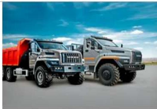
2- расм. УРАЛ“евро-5”.

Қуролли Кучларимиз салоҳияти янада ошганлигига қўйидагилар билан эътироф этишимиз мумкин: жанговар бўлинмалар автомобилда тезкор ҳаракатланиб юқори қўмондонлик томонидан қўйилган вазифаларни тезкор бажарилишини таъминлаш мақсадида замонавий автомобиллар билан таъминланди.