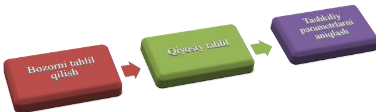
2 – rasm. Tovar raqobatbardoshligini baholash 35

Tovar raqobatbardoshligini baholash asosan uch bosqichdan iborat. Bular quyidagilardan iborat: