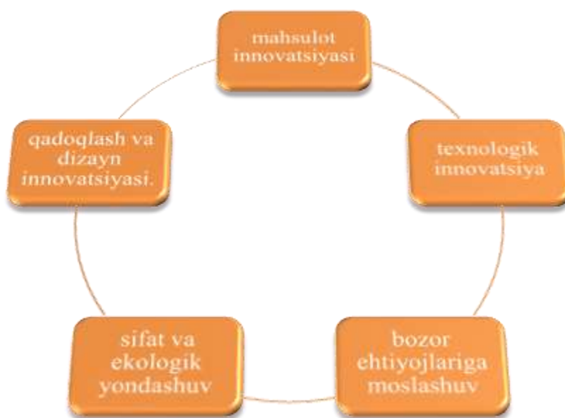
3-rasm. Raqobatbardosh mahsulot ishlab chiqarishda innovatsion yondashuvlar. 36

Tovarning iste’mol parametrlari majmuini aniqlash uning raqobatbardoshligini ta’minlash va tahlil qilishdagi eng muhimdir. Tovarning iste’mol parametrlari majmuini aniqlash deganda, tovarning xaridor (iste’molchi) uchun muhim bo’lgan, uning sifatini, foydaliligini, qulayligini va narxga nisbatan qiymatini belgilovchi asosiy xususiyatlari va ko’rsatkichlarini aniqlash tushuniladi.