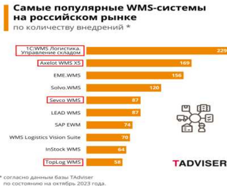
1-график. 2023-йilda Rossiyadagi talab katta bo'lgan WMS tizimlari.