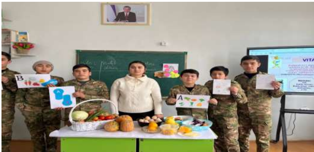
1-rasm. Interfaol metodlardan foydalangan holda tashkil etilgan dars jarayoni.

Nutq rivojlanadi: O'quvchi ma'lumotni shunchaki o'qimaydi, uni boshqaga tushuntirishga majbur bo'ladi.